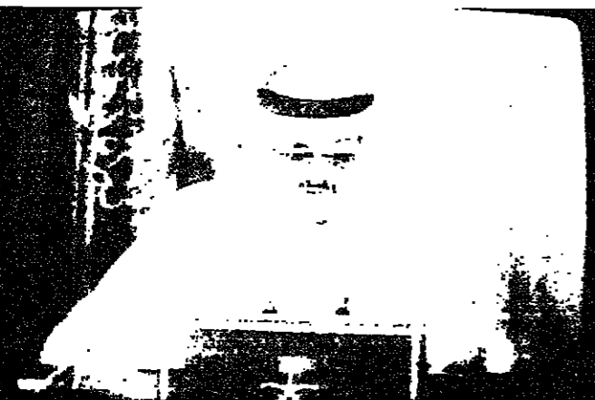
الملك السعودي خلال التآه خطبه المتلفز

تحقق امال الامة العربية وتحرز مسيرتها نحو التضامن ووحدة الكلمة... وقال مصدر مسؤول لوكالة الانباء السعودية، بعد كلمة الملك فهد، ان المزيد من القوات ستصل اليوم وغدا (امس واليوم). وأضاف المصدر قوله ان استجابة، الالتقاء العرب والاصدقاء في دول الغرب تدل على مدى تفهم تلك الدول للمخاطر التي تواجهها الامة العربية في هذه الاونة الدقيقة من تاريخها... ولم يذكر المتحدث اسماء الدول التي وافقت على ارسال قوات الى المملكة. الرياض - ر